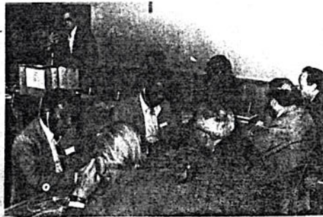
በስሚናር ላይ ተካፋዮች የነበሩ አራት ኢትዮጵያውያንና ሌሎች ሊቀውንቶችን