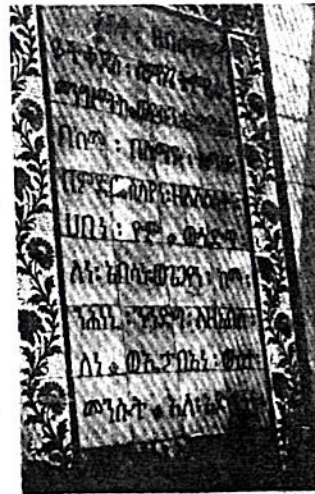
የኢትዮጵያውያን ተደምገትን በግሪክ ሰጠው በግሪክ ቋንቋ እውነተኛ ማስረጃ ተጽፎ ከሌሎች ገንታውያን ጽንጻዎች ጋር በደብረ ዘይት ይታያል

አይገባም ብሎ በግትረብ ከፍ ያለ ክር ክር አድርገናል። ይሄውም ተከታትለን የበለጠና እውነተኛ ማስረጃ በ1400 ዘ መን ኢየሩሳሌምን ይገዙ የነበሩ ነገሥ ታት ዓረቦች ሳይሆኑ መግለክ የተባሉ መሆናቸውን ታሪክ ፈለከሁን (የፍል ስጭኤም ታሪክ ክብረ ነገሥታት) አቅር በን ከገጽ 216 እስከ 232 የተመዘገበው እውነተኛነታችንን አረጋግጧልናል ። የሠልጣን ሰለምም ከገጽ 232 ክፍል 72 በ1517 ዓ.ም በተጠቀሱት አል መ ማለክ የተባሉ ነገሥታት የተመዘገበው ቀርቦለት በፊርማው ያጸደቀው ነው። እ ገዲሁም ሠልጣን ሰለም አመር አብን አልኸጣብ በሰጠው ውሳኔ መሠረት እ ገዲጸና በግሪክ መሪነት የኩርጅና የሐበ ሻ በክብር እንዲጠበቅ አሟል ይህም የ ሰጠውን ትእዛዝ ታሪክ ከኒሳት ኡሩ ሻሌም (የኢየሩሳሌም ቤተ ክርስቲያን) ታሪክ ከተባለው ከገጽ 110 እስከ 111 የተመዘገበውን ከማረጋገጠም በላይ የ መንግሥት የርስት ክፍል መዝገብ ቁ ጥር 151 ገጽ 7 በደንብ ተመዝግቦ ስለ ተገኘ በጆርጳን መንግሥት ተወስኖ ልናል ።