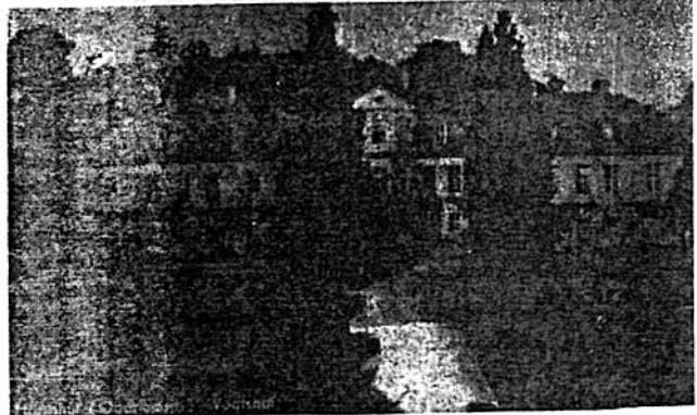
ሰሜናዊ የተካፈሉት ሕንጻ በባርን ሁት

ሰሸያሊዝም ውስጥ እንድትሆን እንደሚችልን ማሳደግ ለዚህ መሠረት ክርስቲያናት ሰሸያሊዝምን የነረጋ ጥላቻው ለክርስቲያን ወደጊዜም ለመቅረት አይፈልጉም። ሰሸያሊዝም ከእምነት በስተቀር በማንኛውም የፍልስፍናው ይዘት ከክርስትና የሚለይበት መንገድ ስላለ ለ ክርስቲያናትን እያስደነበረች ውም = ሁለተኛ ክፍሎች የሚለ ያዩበትን የፍልስፍና እይነት ጠብቀው በሚገናኙበት መንገድ በእንደነት ለሀገራቸው ዕድገት ብልጠናና መሻሻል ይሠራሉ። ፲. በአሁኑ ጊዜ የጎብረተ ሰብአዊት ጀርመን የሕዝብ ቁጥር 18 ሚሊዮን እንደሚሆን ታውቆአል። ከዚህ መካከል የክርስቲያናት ቁጥር ምን ያህል ይሆናል? መ. ከሀገሪቱ ሕዝብ ግማሹ (9. ሚሊዮን) ክርስቲያን መሆኑ ተረጋግጦአል። ፲. የሰሜናዊ ውጤት ምን ነበር? መ. ይህ እይነት ለሚኖር ለቤተ ክርስቲያን የመጸሕፍት አሳታሚዎች በሰሸያሊዝም ሀገር ሲደረግ የመጀመሪያ ጊዜ ነው። የሰሜናዊ ተካፋዮች በየሀገሮቻቸው ስላለው የሕትመት ሥራ እንቅስቃሴ በግስረጸታቸውና አዳዲስ የግሳተም ሥራ ዘዴ በመቅሰማቸው በሰሜናዊ ተደስተዋል። በመሆኑም ተመሳሳይ ለሚኖር በሌላ የሶሻሊስት ሀገር እንዲደረግ የሲሜናዊ ተካፋዮች ወስነው ጊዜውንና ቦታውን የሲሜናዊ አስተናጋጅ ሀገር ምሥራቅ ጀርመን ከምርልፍ አሰጠዋቸው ርድ ከክርስቲያን ኮሚቴዎች (የዓለም ክርስቲያናት የመገናኛ ዘዴዎች ግንባር) ጋር ተነጋግሮ እንዲወስን ተብሎ አልፏል። በግለሰብ አራተኛ የአሳታሚ ድርጅት ጎሳዎች አቶ አማር ግጥ አቶ ተስፋዬ ዳባ አቶ ዘመድሁን ብዙ መቅና አቶ እሱ በላው ሠላሳ ገልጠው ለገደዱ።