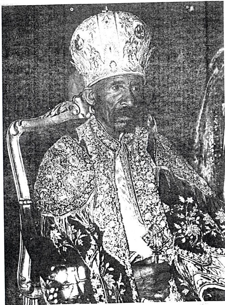
የብፁዕ ወቅዱስ አቡነ ተክለ ሃይማኖት የኢትዮጵያ ኦርቶዶክስ ተዋሕዶ በተከርሱትን እምነትና ታሪክ ፡ ልማትና የግብረ ገብነት ትምህርት በተግባር ግምር እንዲተረጎሙ ለሥራ እንነሣ የሚል ስልፍን “ትንሣኤ” ተብሎ ተሰይሟል።