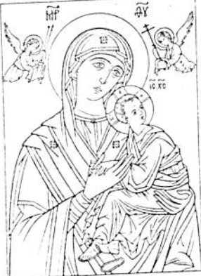
የሉቃስ ልዩ ምዕራፍ ፩ ወገን ልዩ ምዕራፍ ፩

ፍገጋግርያም ኤልሳቤጥን እንደ ጉበኝት ማርያምም በዚያ ወራት ተነሥታ ወደ ተራራግው አገር ወደ ይሁዳ ከተማ ፈጥና ወጣች፤ ወደ ዘካርያስም ቤት ገብታ ኤልሳቤጥን ተሳለመችት። ማርያምም ሰላምታ በሰማች ጊዜ ፅንሱ በማገገማዋ ውስጥ ዘለለ፤ በኤልሳቤጥም መንፈስ ቅዱስ ጥላባት፤ ማርያምም ሆኖ ለእያንዳንዱም ልጅ ለአባት ለእንቺ ከሴቶች መካከል የተባረከኸ ነኝ፤ የማገገማዋ ገዢም ፍሬ የተባረከ ነው። ማርያምም ለእናት ወደ እኔ ትመጣ ዘንድ እንዴት ይሆንልኛል? ማንነህ፤ የሰላምታሽ ድምፅ በጆርዮ በመጣ ጊዜ ፅንሱ በማገገሙ በደስታ ዘሉክልና ማርያምም የተነገረላት ቃል ይፈጸማልና ያመነች ብዕዕት ናት።