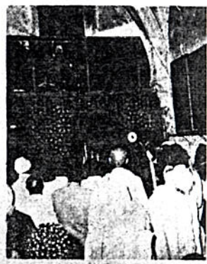
በደር ሡልጣን የኢትዮጵያ ገዳም የእርሳታዎች ስርዓት

በጎልጎታ የተያያዘ በስተደቡብ በኩል በምድር ቤት የሚገኘው የሐበሻ ቤተ ክርስቲያን ነው። በሩም ወደ ደቡብ የሆነና ትልቁ ገዳም ደር ሡልጣን ም የዚሁም ገዳም መግቢያ በር በጎልጎታ ደጃፍ አደባባይ ነው። በዚሁም ገዳም ዙሪያ የሚገኘው ቦታ ሁሉ መኖሪያውና ቤቶቹም ሁሉ የካህናት አልባሳት ማኖሪያ በተቆለፈው ትልቁ ሰንደቅ ውስጥ ያለ ነው። ይህም ደግሞ በዚሁ በተጠቀሰው ገዳም የሚገኘው ከከፍተኛው ቤተ ክርስቲያን ውስጥ ነው። ይህ ሁሉ በዝርዝር የተጻፈ የሐበሻ ይዞታ ነው። ከደር ሡልጣን ከተያዘው የሌሌ ቤተ ክርስቲያንም የኢትዮጵያውያን ናት። ሡልጣን ሳሊም ይህ ከላይ የተጻፈው ለንጉሡ ቀርቦ የተነገረ በዚሁ በተወሰነው ትእዛዝ መሠረት ይህ የተቀደሰው ትእዛዝ የጸና ይሁን። ይህን ትእዛዝ አረርሳሌ ብሎ ለመቃወም የሚሞከር ከልዑል እግዚአብሔር ሰይፍ በታች ይውደቅ። በተወዳጁ ነቢይና በእግዚአብሔር ረዳትነት ወደ ተቀደሰው የፈጣሪዎችን ከተማ (ለማየት) መጣሁ። ሰፈር በሚባለውም ወር በ25 ቀን 1923 ዓመተ ሕጅረ በ15